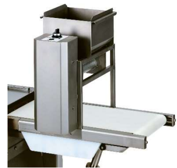
Automatischer Mehlstreuer aus Edelstahl mit präziser kontinuierlicher oder Intervall-Mehldosierung (Option).