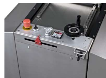
Die SLIM ist mit einer Geschwindigkeitsregelung und einem Stückzähler ausgestattet.