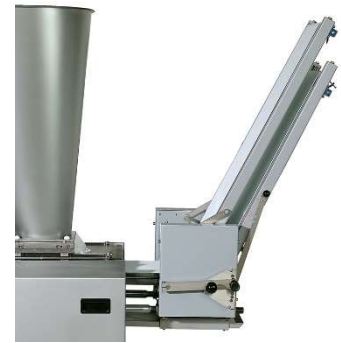
Optional mit doppeltem Ausgabeförderband für Ausgabehöhe bis max. 165 cm.