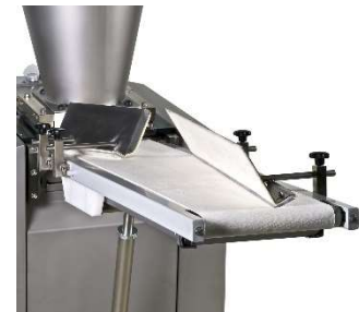
Große Bandbreite an optionalen Vorrundwirker- und Rundwirkermodulen